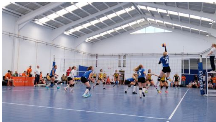
Sophie Ten Asbroek in actie tijdens de EUG

In de daaropvolgende 7-meterworpenserie, die te vergelijken is met de penaltyserie in het voetbal, blonk sluitpost Van Grunsven opnieuw uit door drie worpen te keren (één op de paal). Na zes worpen werd de wedstrijd beslist door de 21-jarige Joost Venendaal. Het Nijmeegse handbalteam eindigt door de zege als vijfde in het handbaltoernooi.